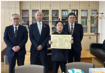
鶴田町立鶴田小学校